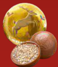
Boule Noël praliné biscuit lait