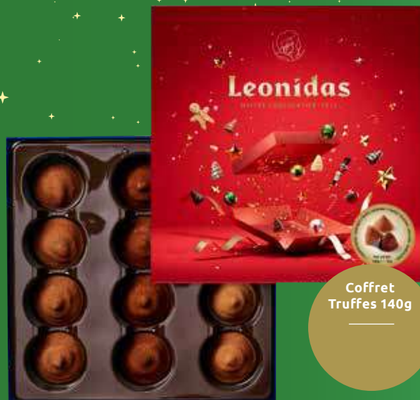
Coffret Truffles 140g