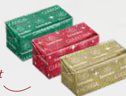
GIA Praliné, praliné aux brisures de feuilletine, praliné aux éclats d'amande