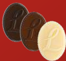
LOUISE Praliné saveur caramel, Praliné saveur caramel aux noisettes caramélisées