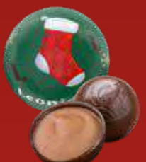
Boule Noël praliné noir