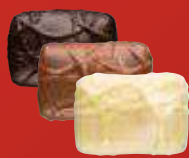
NOISETTE MASQUÉE Praliné avec une noisette entière