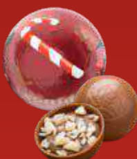
Boule Noël praliné pétillant lait