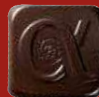
ALEXANDRE Crème de caramel aux morceaux d'écorces d'orange légèrement confites