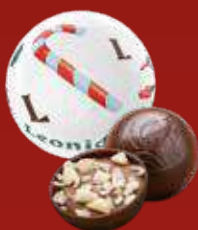
Boule Noël praliné pétillant noir