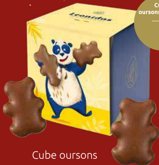
Cube oursons 8 pièces