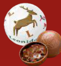
Boule Noël brownie lait