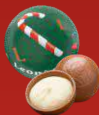
Boule Noël vanille lait