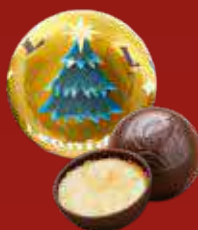
Boule Noël crème brûlée noir