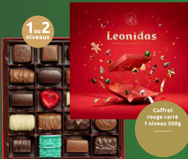
Coffret rouge carré 1 niveau 300g