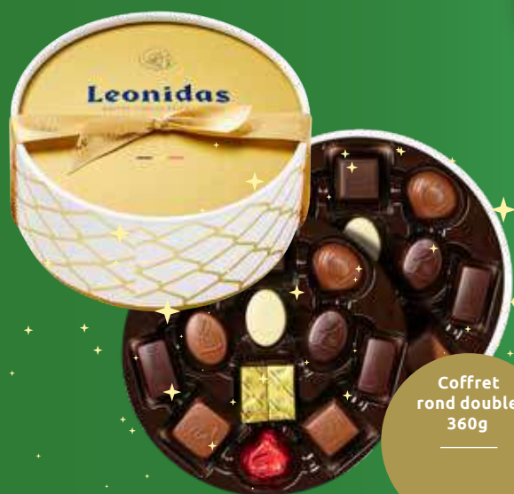
Coffret rond double 360g