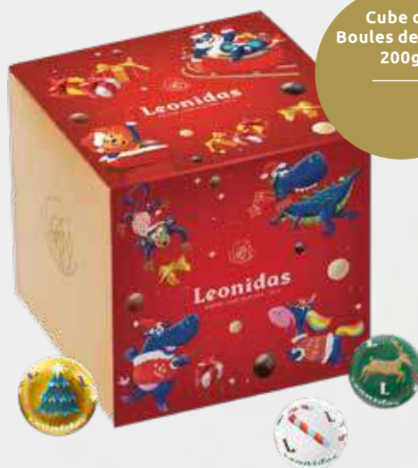
Cube de Boules de Noël 200g