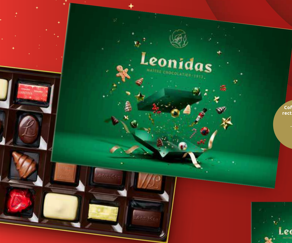
Coffret vert rectangulaire 255g