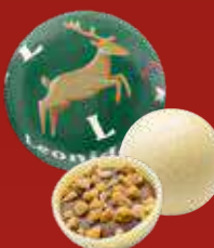
Boule Noël praliné noisettes blanc