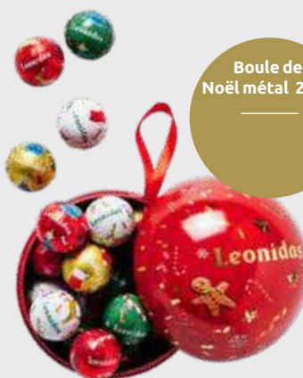
Boule de Noël métal