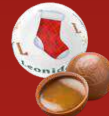
Boule Noël caramel salé lait