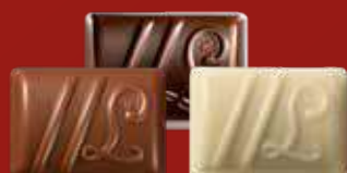
DUETTO Ganache au chocolat noir à la fraise et vinaigre balsamique ou au chocolat au lait, crème de nougat et graines de sésame ou au chocolat noir yuzu et saveur fruit du dragon