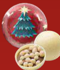
Boule Noël praliné riz soufflé blanc