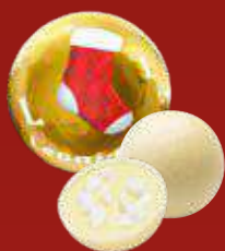
Boule Noël citron meringue blanc

★ Découvrez notre nouvelle collection étendue de Boules de Noël. Désormais, notre gamme comprend 13 délicieuses boules, avec 5 nouvelles saveurs exquises ajoutées à notre sélection. Chaque boule est une petite merveille gourmande, parfaite pour les fêtes de fin d'année. Que vous les offriez en cadeau ou que vous les dégustiez avec vos proches, elles apporteront une touche magique et gourmande à vos célébrations de Noël.