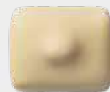
MANON CAFÉ BLANC Crème au beurre au café, praliné et noisette entière

Pour rendre notre ballotin encore plus festif, nos Gia's se parent d'un habit de Noël.