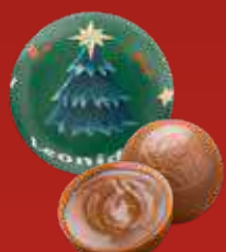
Boule Noël pâte de noisettes lait