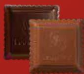
CARRÉ CROQUANT Praliné au riz soufflé