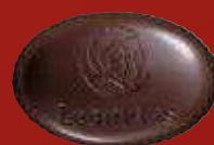
SÈTE Chocolat noir, caramel à la fleur de sel rose parfumé de touches de violettes