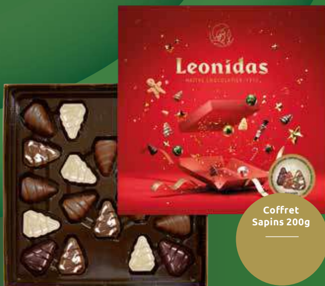
Coffret Sapins 200g