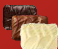
CASALEO Praliné au riz soufflé