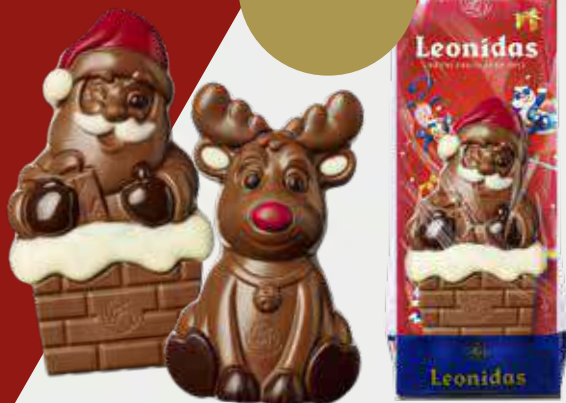
Sachets sujet creux 50g