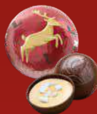
Boule Noël Mont-Blanc Marron noir