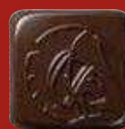
BRETAGNE Crème de caramel au sel de Guérande