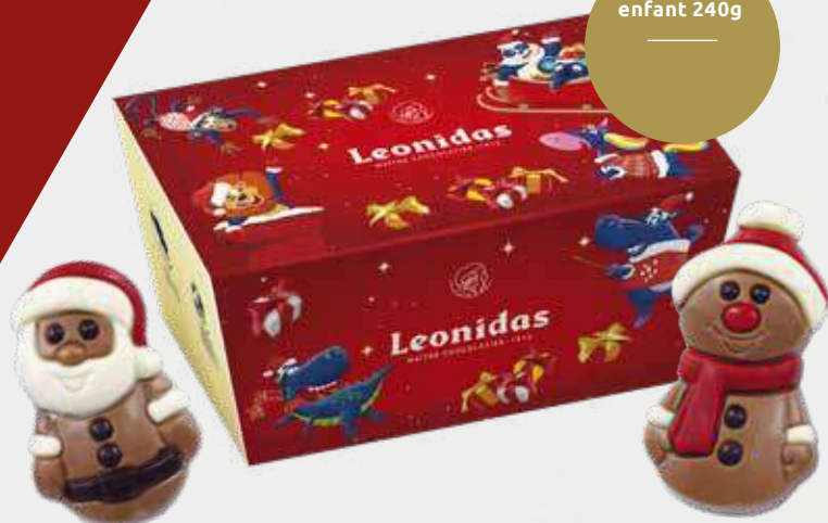
Ballotin enfant 240g