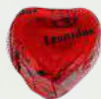
FOREVER ROUGE Chocolat au lait, praliné