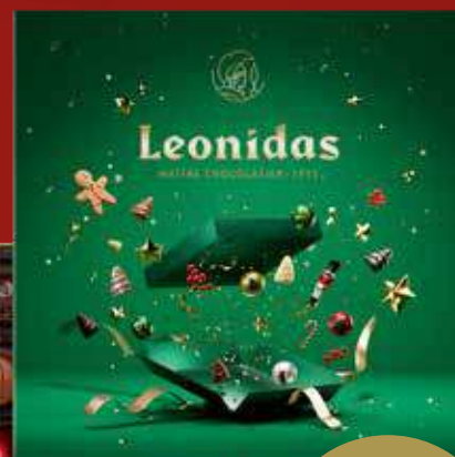
Coffret vert carré 300g