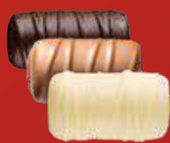
BÛCHE PRALINÉ Praliné tendre