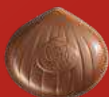
MARRON CAFÉ LAIT Praliné saveur café